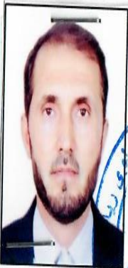
مهر مقام وزارت / اداره / ولایت