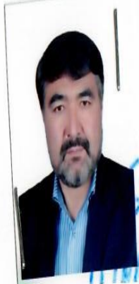
مهر مقام وزارت / اداره / ولایت