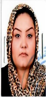
مهر مقام وزارت / اداره / ولایت