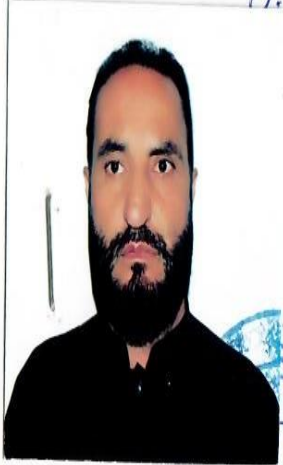
مهر مقام وزارت / اداره / ولایت