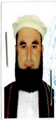
مهر مقام وزارت / اداره / ولایت