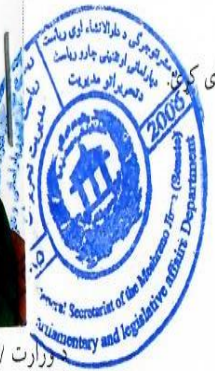
وزارت / ادارې / ولایت مهر او لاسلیک