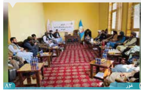
۸۲ | غور

مراسم افتتاح نمایندگی پشتنی بانک در ولایت غور در فضایی سرشار از امید، همدلی و تعهد به توسعه اقتصادی با حضور نمایندگان ادارات مختلف برگزار گردید.