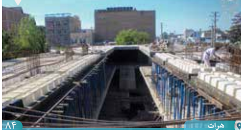
۸۴ | هرات

کار پروژه اعمار اسکلت چهار طبق از ۷ طبقه تعمیر خانه فرهنگ واقع تانک مرکز مربوط ناحیه ششم شهر به هزینه حدود ۲۶ میلیون افغانی از بودجه انکشافی ښاروالی هرات جریان دارد.