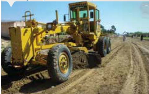
۸۵ | هرات

د هرات ښاروالی د پنځمې، اتمې او پنځلسمې ناحیو اړوند له تخت صفر څخه د غیاثیې پوهنتون پورې د ښارې حلقوي سړک د جوړولو پروژې کار د ۵.۵ کیلومتر په اوږدوالي او ۱۰ متر عرض سره د هرات ښاروالی داخلي عوایدو څخه د شاوخوا ۷۵ میلیون افغانی په لگښت په څلور برخو کې جریان لري.