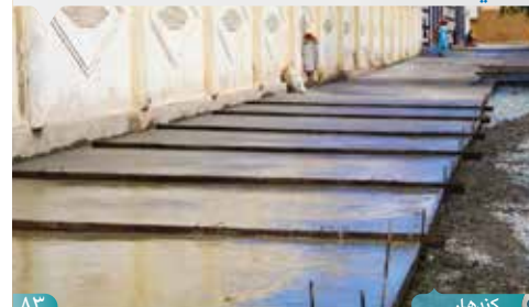
۸۳ | کندهار

مسئولین وایي، دا پروژه چې شاوخوا ۱۶ میلیونه افغانی لگښت لري، په راتلونکو دوه نیمو میاشتو کې به بشپړه شي او هره ورځ به لسگونو کسانو ته د کار زمینه برابره کړي. ښاروالی ټینگار کوي چې دا ډول پروژې د ښارې پرمختگ او د خلکو د ژوند اسانتیا لپاره مهم گام دی.