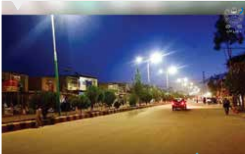
۸۶ | اروزگان

ترینکوټ ښاروالۍ د خپلو عوایدو په پر مټ په ښار کې د ۳ میلیونه افغانیو په ارزښت د تنویری څراغونو پروژه بشپړه او گټې اخیستنې ته وسپارله. د دې پروژې له مخې د ښار عمومي سړکونه او څلورلارې د عصري څراغونو په وسیله روښانه شوي، چې نه یوازې یې د ښار ښکلا زیاته کړې بلکه د شپې له پلوه یې د تگ راتگ اسانتیاوې هم برابرې کړې دي.